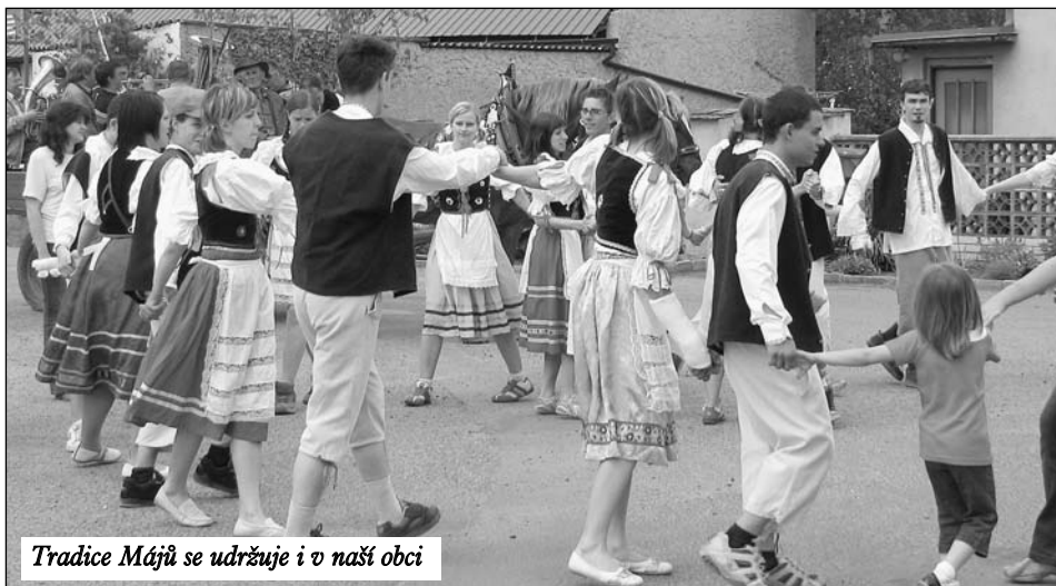
Tradice Májů se udržuje i v naší obci