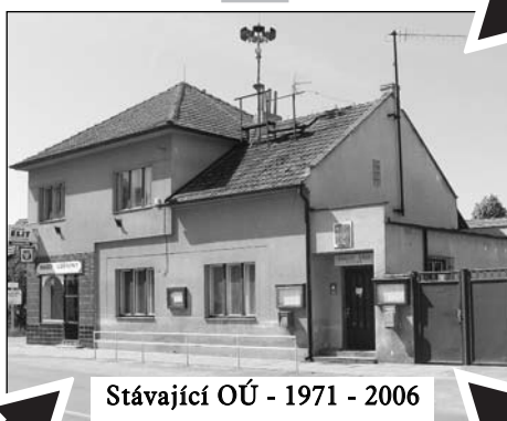
Stávající OÚ - 1971 - 2006

Stará škola. Postavena v roce 1809 a jak říkají kroniky, do těchto malých skromných prostor mělo docházet 150 i více dětí. Neuvěřitelné. Byla to ale jiná doba, jiné nároky a jiný způsob výuky. A navíc se ani tak přísně na docházku dětí do školy nehledělo. Svému poslání sloužila až do vybudování nové školy. Pak byla upravena na byt a posléze v poválečných letech zde byl zřízen MNV. V roce 1971 pro svůj zchátralý stav byla budova zbourána a na jejím místě byl vybudován parčík.