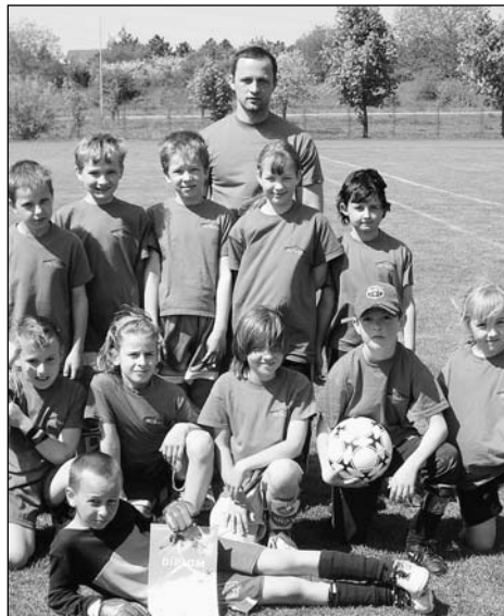
Naše úspěšné školní fotbalové družstvo

P. S. Pane učitelé želínku, blahopřejeme a děkujeme. /red/