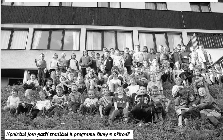
Společné foto patří tradičně k programu školy v přírodě