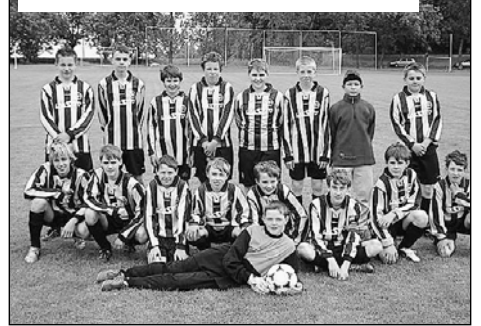
Družstvu žáků se letošní sezona povedla

Děkujeme všem sponzorům, trenérům a všem lidem, kteří pracují kolem chodu oddílu, za práci v uplynulé sezoně.