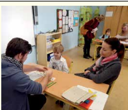
K zápisu do prvního ročníku, který se konal 5. 2. 2015, se dostavilo 33 dětí. 27 z nich požádalo prostřednictvím svých zákonných zástupců o přijetí do školy, 6 z nich požádalo o odklad. Těšíme se na všechny budoucí prvňáčky.