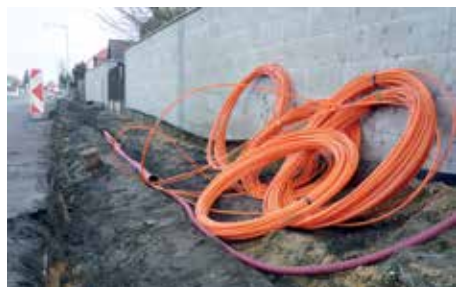
Součástí opravy chodníku je i pokládka nového vedení veřejného osvětlení.