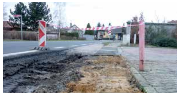
Práce na rekonstrukci se naplno rozjely počátkem února.