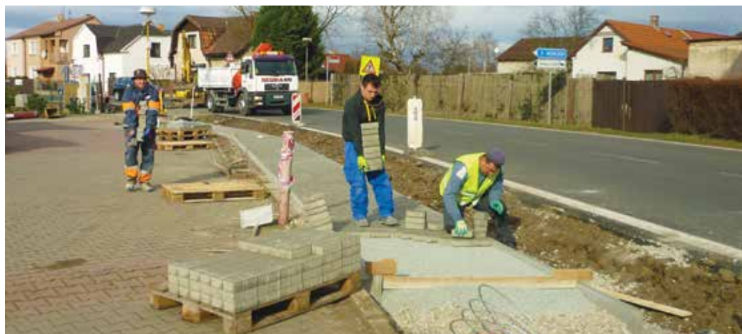
Zhotovitelská firma využívá příznivého počasí a práce pokračují i o víkendech.