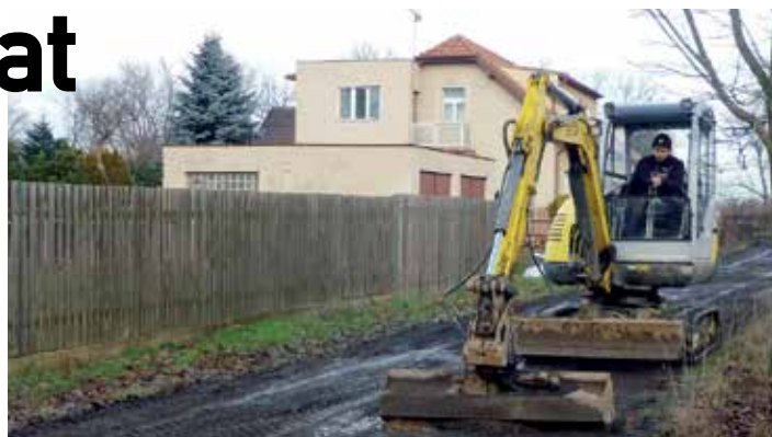
Další z ulic s nepevným povrchem, která prošla rekonstrukcí, je ulice U Zastávků.

V posledních letech se takto opravily ulice V Úvoze (2014), Hasičská (2015) a v letošním roce by měla zásadní opravou projít ulice Sokolská. Samostatnou kapitolou jsou komunikace s nepevným povrchem. Často se jedná o ulice, kde v posledních letech proběhla výstavba nových domů a tento typ komunikací výrazný nárůst dopravního zatížení zkrátka nevydrží a ulice připomínají spíše tankodrom. Udržet v solidním stavu komunikace s nepevným