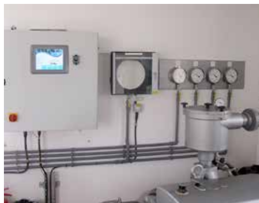
Nový displej monitoringu.