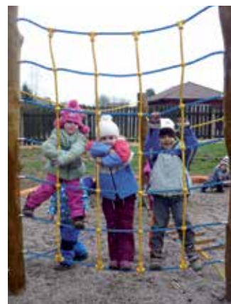
Nové herní prvky jsou v neustálém obležení dětí.