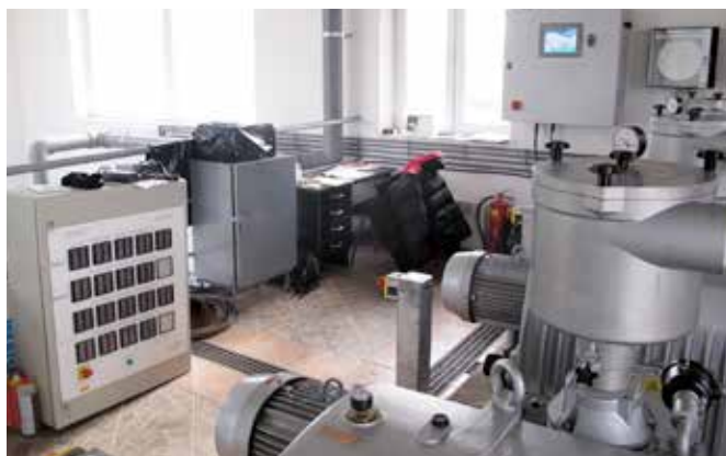
Demontovaný starý panel monitoringu.

V posledním vydání TR popsal Ing. Švan- da změny, ke kterým došlo v systému monitorování funkce odsávacích ventilů ve sběrných šachtách nové části kanalizace, a také vysvětlil, jaké výhody přinese pro obsluhu nový, moderní displej monitoringu. Přinášíme fotografie, které ukazují markantní rozdíl mezi starým a novým zařízením. (pb)