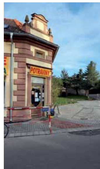
V polovině dubna byly dokončeny práce na přístupové ploše k prodejně potravin v Kozlech.