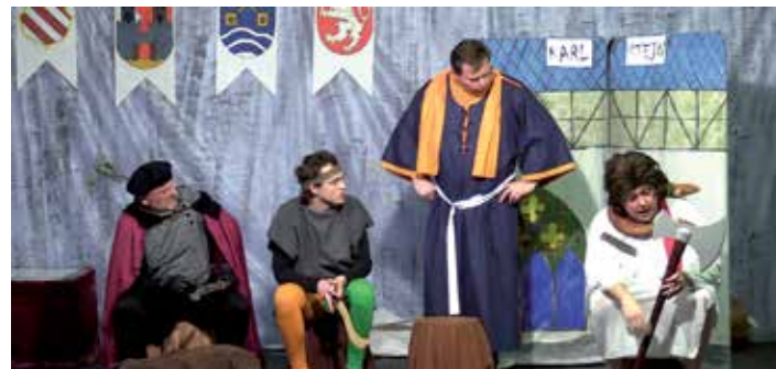
Muži byli plni obav, co jim přinese nápad s praním jejich špinavého prádla.