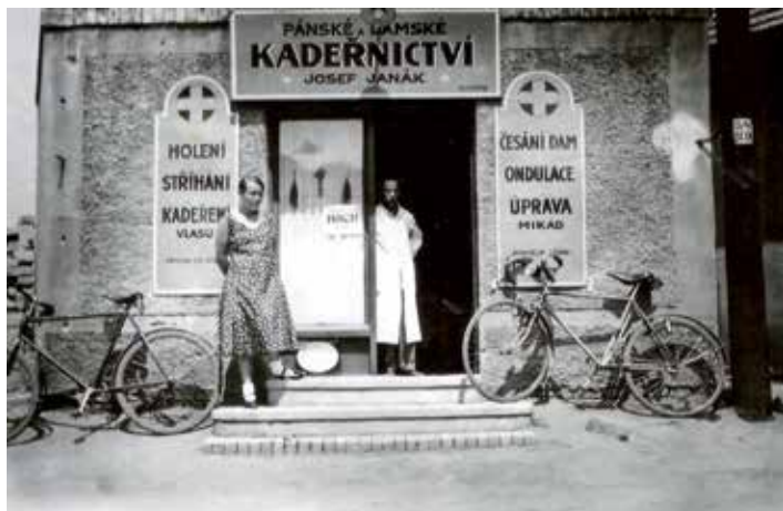
Po bývalém kadeřnictví a výkupně mléka zbyla jen část podezdívky.