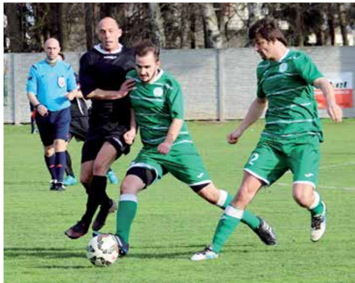
Ze zápasu mužů Tišice - Mělník.

První dvě kola jara jsme věděli, že nebude lehké bodovat s druhým Mělníkem a čtvrtým Bousovem. V prvním případě se nám zápas vůbec nepovedl a prohráli jsme vysoko 1:6. V Bousově hra už byla o něco lepší, ale body se nám přivést také nepovedlo (3:0). Důležitý zápas byl s Velkým Borkem, který je bodově za námi. Soupeř nám dal příležitost a prostor hrát většinu času na jejich polovině. Ale nefungovalo nám zakončení. První branka do borecké sítě byla vlastní. Bohužel v 54. minutě a v 92. jsme dostali nešťastné góly. Konečný výsledek 1:2 pro Borek byl pro nás zklamáním. Do konce sezóny je ještě 10 kol, tak doufejme, že nám to tam bude více padat.