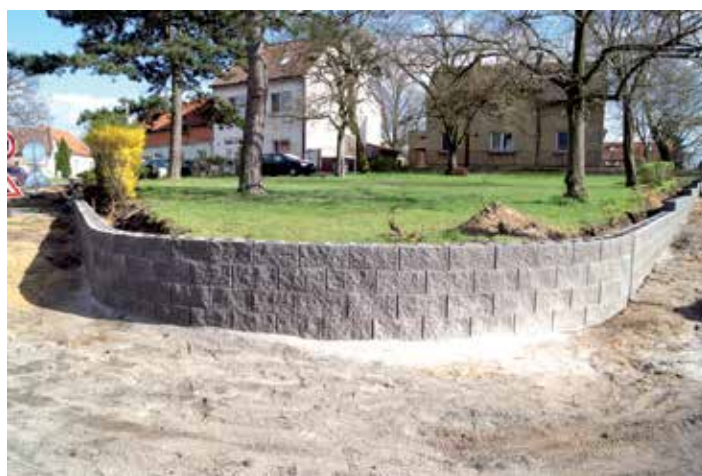
Nové obezdění parku přineslo i rozšíření komunikace a zpřehlednění dopravní situace na křižovatce ulic Mlékojedská a Na Pastvičkách.