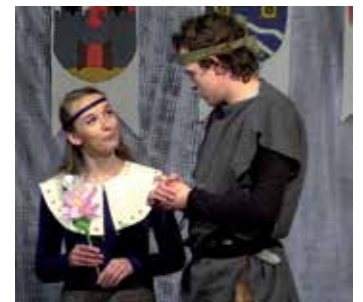
Výborné výkony podali nejmladší členové souboru.