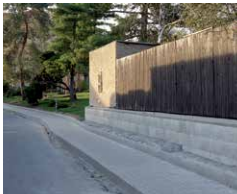
Nový chodník k základní škole přispěl k vyšší bezpečnosti dětí.