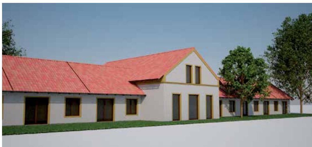
Ilustrativní studie Komunitního domu pro seniory. V současné době je k náhledu jen její návrh, který bude dále rozpracován.

Ovšem nejzásadnějším počínkem v rámci péče o seniory je jistě záměr, který byl schválen na posledním zasedání obecního zastupitelstva.