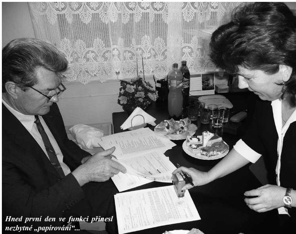
Hned první den ve funkci přinesl nezbytné „papírování“...