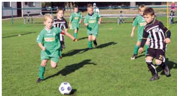
Ze zápasu mladší přípravky Tišice - Kostelec.