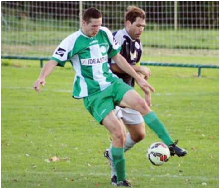
Muži vyhráli nad Libiší 4:0.