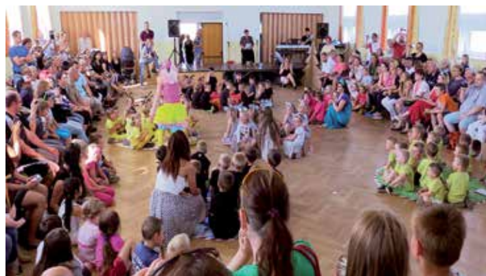
Závěr první části patřil hudební pohádce v podání všech dětí a učitelek.