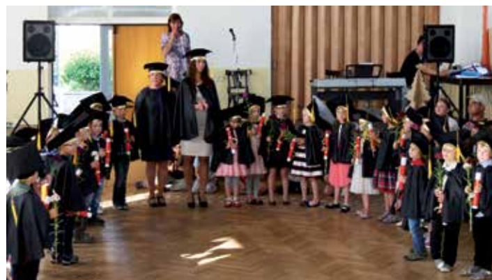
Vyřazení dětí odcházejících do prvních tříd mělo slavnostní ráz.