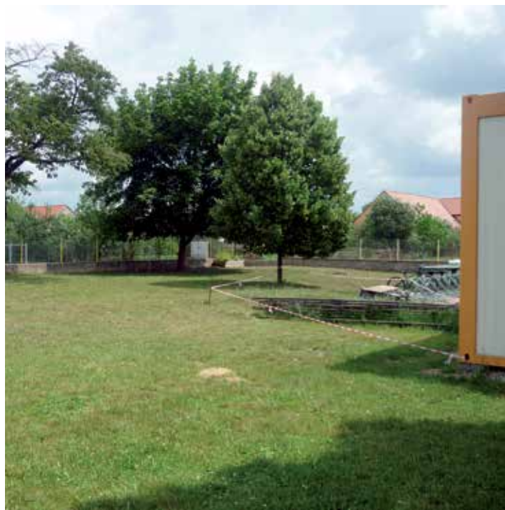
Místo, kde se v nejbližších dnech začne budovat multifunkční hřiště.

Multifunkční hřiště беру jako první krok k výstavbě tolik potřebné tělocvičny a zároveň jako místo, kde děti budou sportovat v mě-