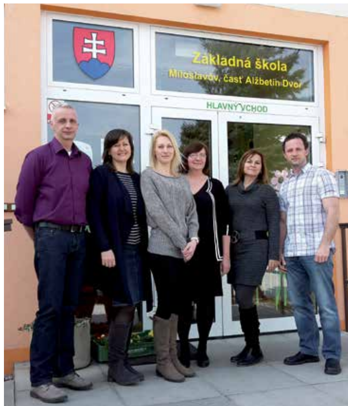
Zástupci obou partnerských škol a koordinátoři celého projektu se sešli na Slovensku.

Poznámka redakce: Z historických pramenů víme, že základní škola spolupracovala v minulosti se školami: