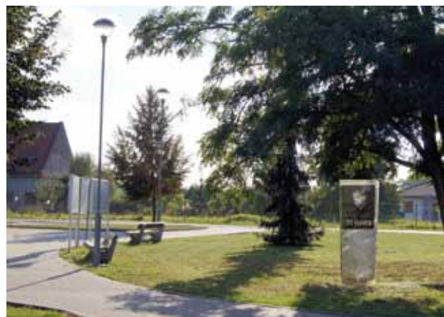
Fotomontáž naznačuje, kde by mohl být umístěn památník čestného občana Tišic T. G. Masaryka