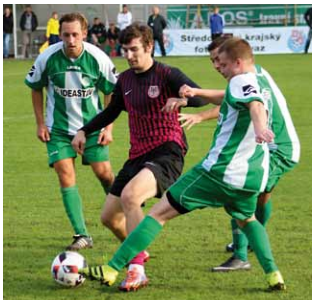
Některé herní situace si v ničem nezadaly s těmi prvligovými.