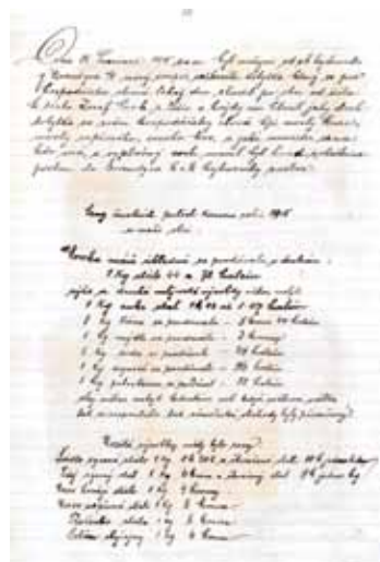
Ceny „živnostních“ potřeb v roce 1915.