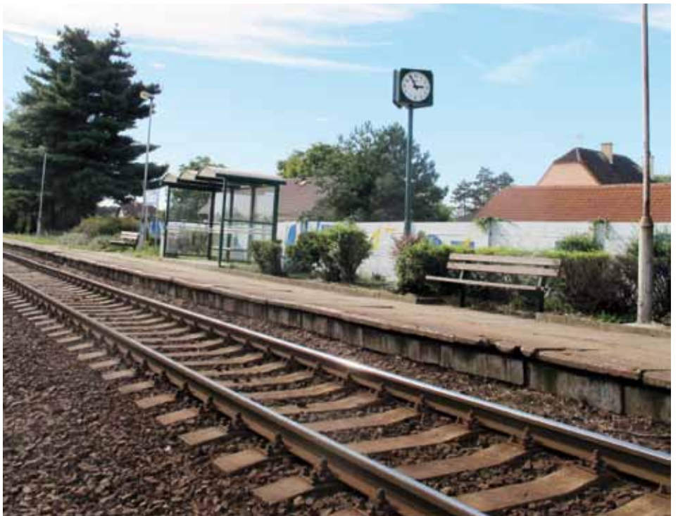
Proměna železniční zastávky Tišice udělala z tohoto místa velmi příjemný kout, který oceňují nejen místní, ale i projíždějící cestující.

V prostorách vlakové zastávky je ještě stále co zlepšovat, takže se cestující mají na co těšit. A návštěvníci webových stránek Tišic budou také brzy moci vyjádřit svůj názor na proměnu nádraží v připravované anketě. (jp)