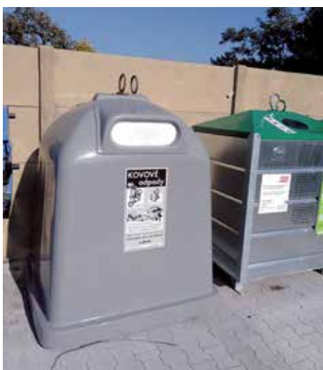
Kontejnery na kov

Od roku 2020 přejdeme na nový systém platby za svoz odpadu. Každý občan bude mít možnost zvolit objem vyprodukovaného odpadu, a tím pádem i ovlivnit, kolik ho likvidace bude stát.