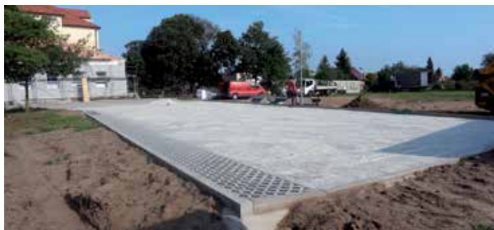
Nová parkovací plocha vyřeší situaci v blízkosti školy.