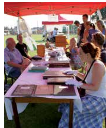
Nechyběl stánek s našimi kronikami ani prezentace včelařů.