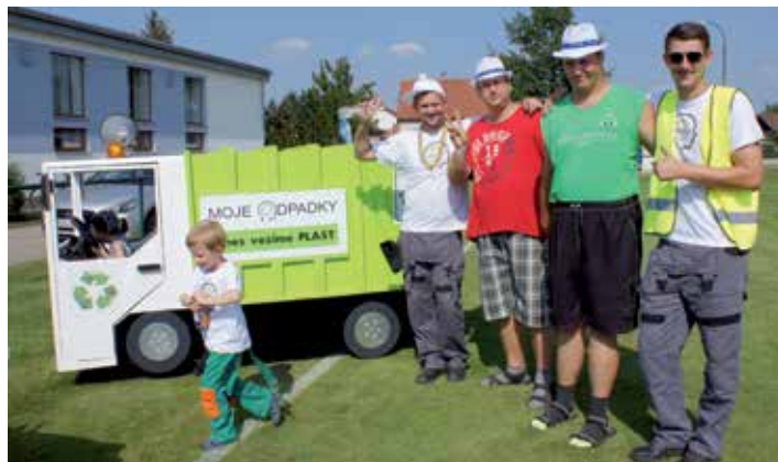
Před dubem za dubem – vystoupení plně známých písniček s texty zaměřenými na třídění odpadů bylo nápadité a hlavně nejen pro děti poučné.