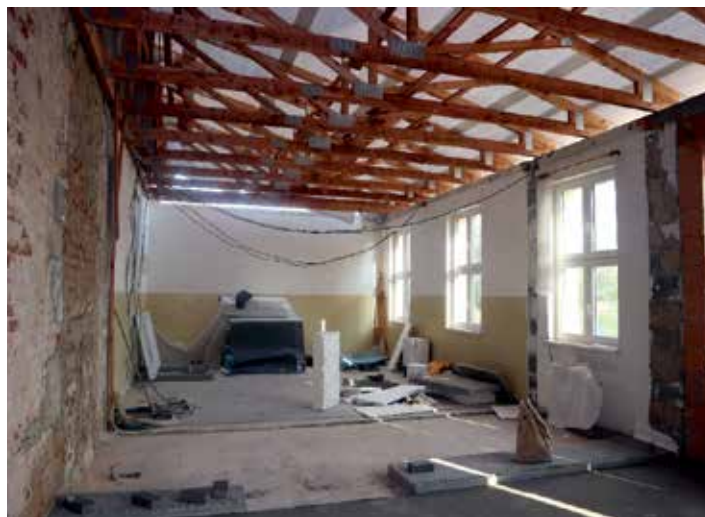
Do rozšířených prostor šatny se vejdou šatní skříňky pro žáky vyšších ročníků.