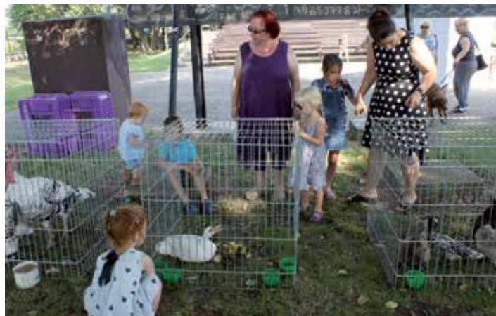
Prezentace chovatelů byla jakýmsi předskokanem před zářijovou výstavou.