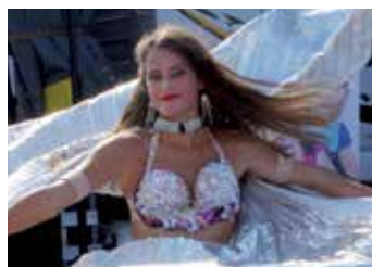
Ženská krása i krása pohybu, tak by se dalo charakterizovat vystoupení břišní tanečnice.