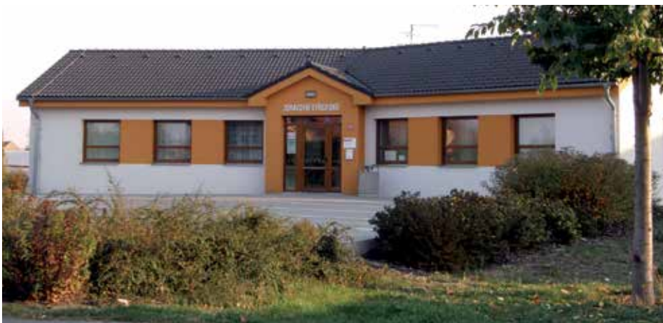
Zdravotní středisko se dočká rozšíření prostor pro pediatra i praktického lékaře.