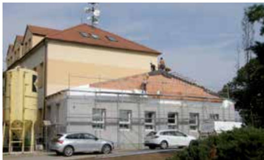
Vrata do areálu a travnatý pozemek podél budovy školy jsou minulostí. Místo nich stojí nové prostory jídelny. Vzadu bude vchod pro žáky z modulových tříd, ty se budou stavět v příštím roce.