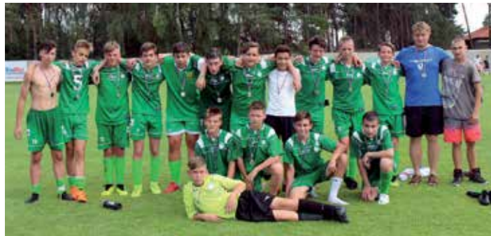
Druhé místo starších žáků ve finale OP.

Tišice – Kostelec 1:2 (Mareš) čtvrtfinále: Tišice – Kostelec 4:1 (Opl, Brodský, Horák, Terziev) Kostelec – Tišice 3:1 (Pokorný) semifinále: Tišice – Čečelice 3:3 (Opl, Mareš, Červinka) Čečelice – Tišice 3:3 prohra po penaltách (Trédl, Kuchař, Šindelka) o 3. místo Tišice – Nelahozeves 2:3 (Červinka, Nejezchleba) Nelahozeves – Tišice 4:2 (Horák, Mareš)