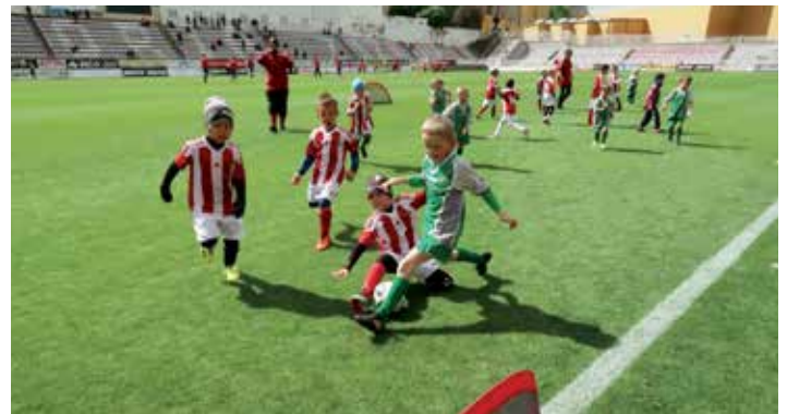
Z přestávkového exhibičního utkání proti malým Viktoriánům.

Letos poprvé byla na okrese základní část rozšířena po vzoru ligy ještě o play off. V základu jsme skončili na prvním místě. Pak jsme se v nadstavbě posouvali přes EMĚ, Cítov/Počáplky, a nakonec jsme se dostali do finále s Kostelcem. Hrál se na dva zápasy, ale bohužel se nám obě utkání moc nepovedla a v obou jsme inkasovali o jeden gól více než soupeř. Medaile z OFS za druhé místo kluky potěšily, ale lehké zklamání bylo v jejich tvářích