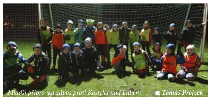
Mladší příprava zápas proti Kostelci nad Labem