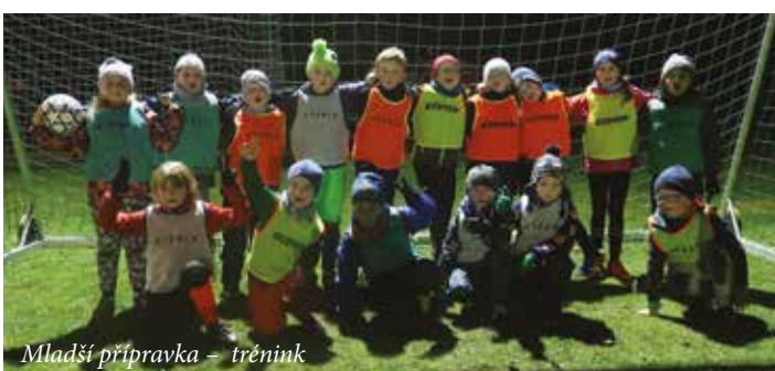
Mladší příprava – trénink