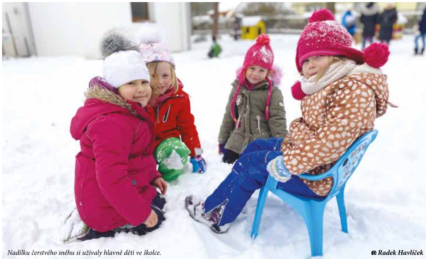
Nadílku čerstvého sněhu si užívaly hlavně děti ve školce.